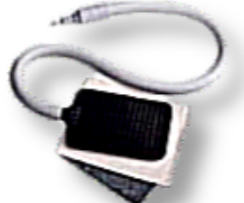
SOFT RUBBER ELECTRODES